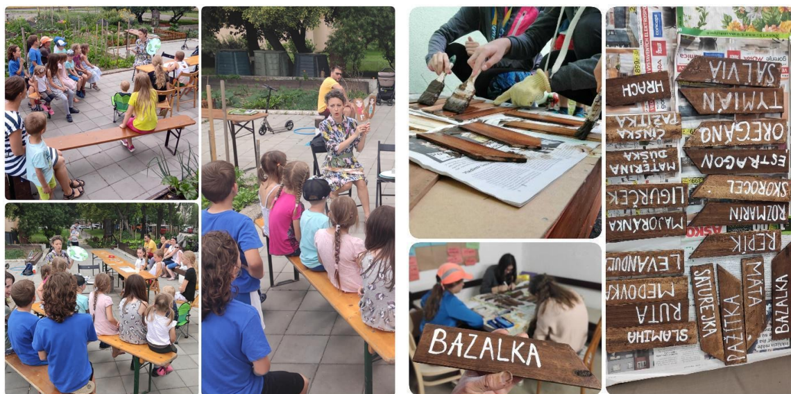
Eko-workshop pre deti a výroba menoviek k bylinkám

Najdôležitejšie pre záhradku a komunitu však bude naďalej podporovať dobré fungovanie vzťahov, komunikáciu a angažovanosť všetkých členov pri starostlivosti o spoločné prvky a chod záhradky i združenia. Bude treba doriešiť manažment vody (zdroj, polievanie), otázku oplotenia a dotvorenie informačnej tabule.