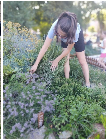
Brigády - prehadzovanie kompostu a zber bylín na sušenie