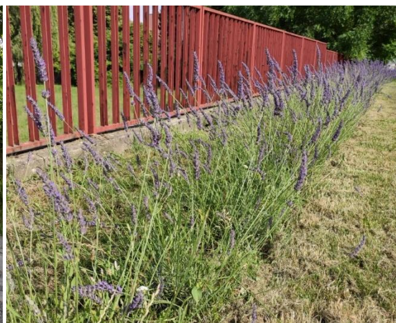
Nový kvetinový záhon pri vstupe a levanduľový pás pri plote