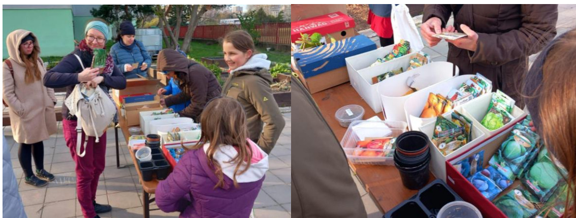
SWAP semiačok jar 2023

Kľúčové pre záhradku a komunitu bude naďalej podporovať dobré fungovanie vzťahov, komunikáciu a angažovanosť členov pri starostlivosti o spoločné prvky a chod záhradky i združenia. Bude treba doriešiť ekologickejší prístup k vode (voda na zavažovanie zo studne, namiesto polievania pitnou vodou) a dotvorenie informačnej tabule.