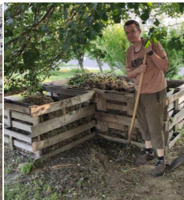
Starostlivosť o kompost - plastové a paletové kompostéry